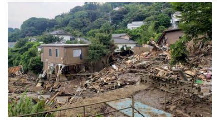
熱海市伊豆山土石流災害の様子